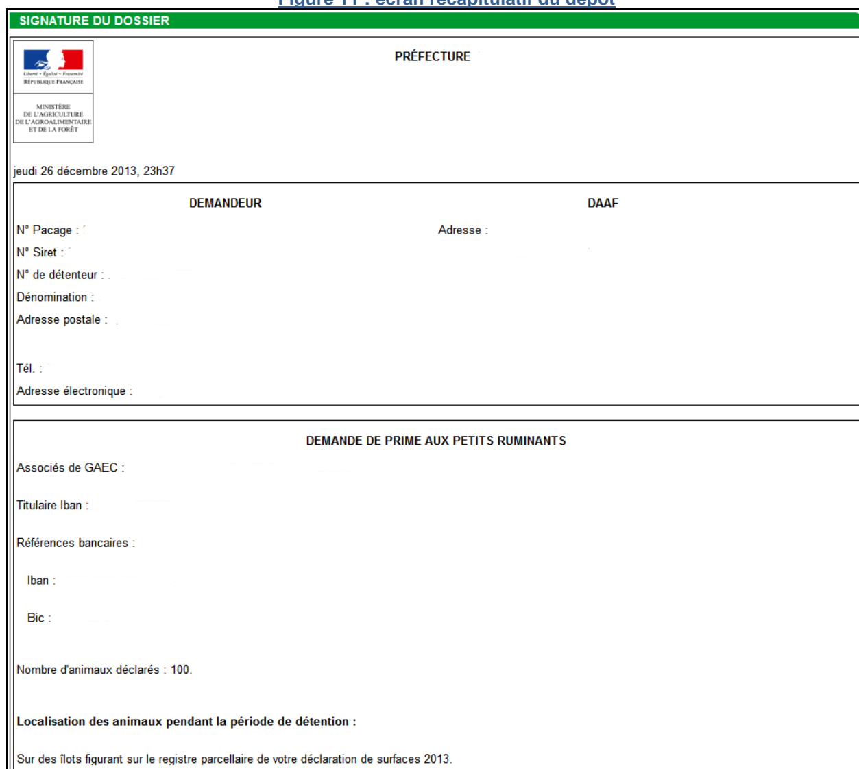
Figure 11 : écran récapitulatif du dépôt

Avant de signer électroniquement votre déclaration, vous devez, en cochant la case prévue à cet effet, attester sur l'honneur l'exactitude des informations fournies et indiquer avoir pris connaissance des engagements à respecter.