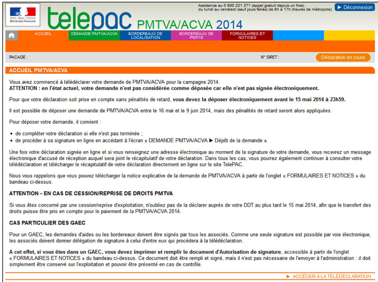
Figure 2 : page d'accueil pour un exploitant ayant commencé sa déclaration PMTVA/ACVA