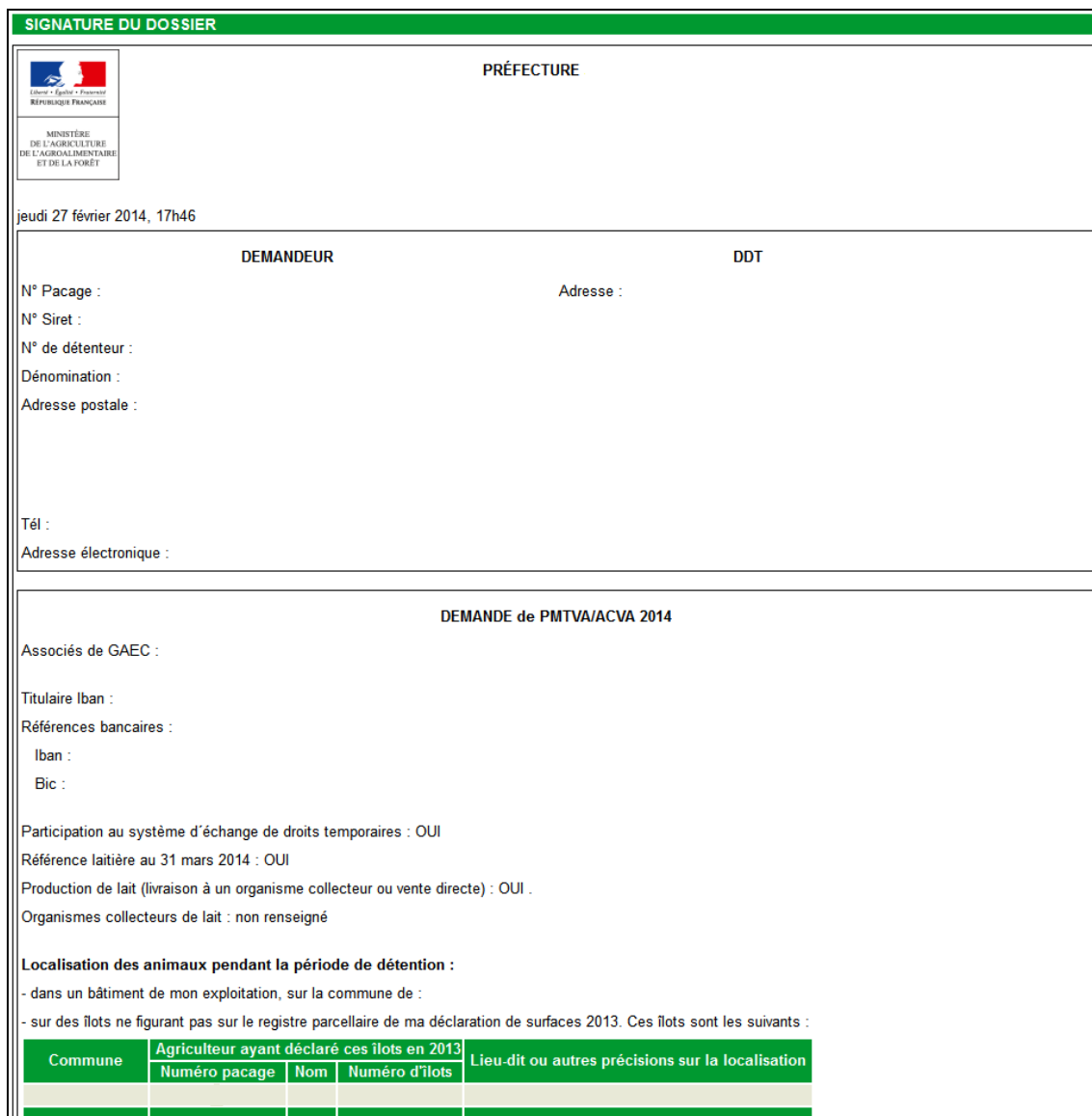
Figure 12 : écran récapitulatif du dépôt

Vérifiez les informations que vous avez télédéclarées et les engagements que vous prenez.